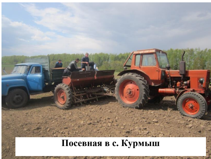
Посевная в с. Курмыш

Первого сентября 2014 года техникум пополнился первокурсниками, обучающимися по новой специальности «Механизация сельского хозяйства». В 2014-2015 учебном году обучалось 355 человек: 139 – по программам подготовки квалифицированных рабочих, служащих и 216 по программам подготовки специалистов среднего звена.