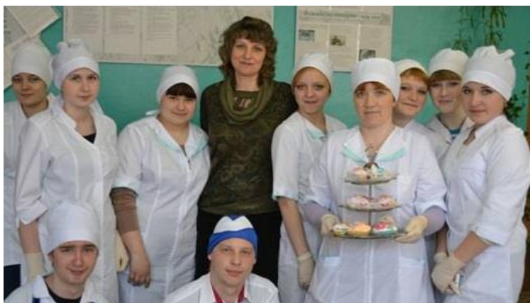
Студенты по специальности "Технология продукции общественного питания"

городскими учебными заведениями. И этот факт подтверждают высокие достижения студентов в районных, окружных и областных конкурсах и соревнованиях.